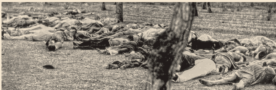
Типичные сцены армянского геноцида весной и летом 1915 года.

Христиан отправляли на "работы" в концентрационные лагеря в Сирийской пустыне. Их грузили в поезда или заставляли идти пешком сотни миль без провизии. Места назначения достигла лишь четверть депортированных. Они умирали по дороге от голода, истощения или жестоких нападений, многих убивали намеренно. Тех, кто пытался защитить армян, ждала та же участь. Карательные отряды в Дейр-эз-Зор разбивали детей о скалы, взрослых изрубали мечами, сжигали людей заживо. Около 200,000 армян обратились в ислам, надеясь спастись. В одном 1915 году было убито около 800,000 армян.