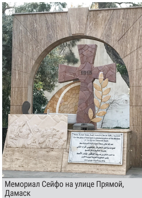
Мемориал Сейфо на улице Прямой, Дамаск

ВТОРНИК 15 Сегодня ежегодный день памяти геноцида сирийских христиан в Османской империи. Этот геноцид называют «Сейфо», что означает «меч». Около четверти миллиона сирийских христиан были убиты в том геноциде, пик которого пришелся на 1915 год. Всего за веру погибло около 3,75 миллионов христиан – сирийцев, армян, ассирийцев и греков. Фонд Варнава проводит сейчас кампанию за более широкое официальное признание правительствами разных стран этой ужасной катастрофы как