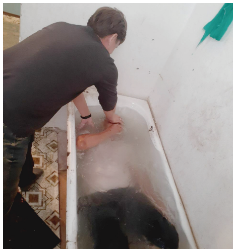
Крещение новообращенного христианина, обратившегося из ислама, Узбекистан

были перекрыты, никого не пропускали, но пастор был уверен, что должен посетить эту семью. Они с женой помолились и поехали. Бог чудесным образом помог им доехать, и никто их не остановил. Они выпили чаю с родственниками и рассказали им о Христе, нашем Спасителе. Все дети и внуки умершей христианки приняли Христа. После отмены карантина образовалось три или четыре новые домашние церкви, 21 человек принял крещение. Этого пастора каждый день приглашают в мусульманские семьи, и мусульмане продолжают обращаться к Христу. С каждым его визитом кто-то обращается к Господу. Молитесь о дальнейшем плодотворном служении этого пастора, о покаянии мусульман и об укреплении в вере новообращенных.