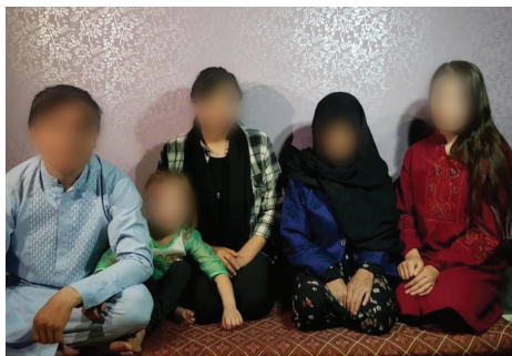
Семья афганских христиан прячется в Афганистане. Фонд Варнава оказал им помощь с основными нуждами

оказались сейчас в большой опасности, когда почти вся страна оказалась в руках Талибана. У многих христиан нет возможности покинуть страну, и они вынуждены прятаться. Они не могут жить в своих собственных домах и подолгу оставаться на одном месте, так как Талибан ищет их и, по всей вероятности, казнит, если найдет. Молитесь также о Божьем водительстве для партнеров Фонда Варнава в этом регионе, так как мы разными возможными способами передаем помощь нашим афганским братьям и сестрам.