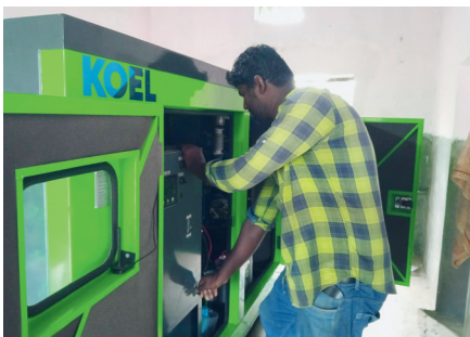
Новый генератор в больнице Нав Дживан в штате Джаркханд дает электричество для медицинского оборудования и жилых помещений персонала на территории больницы