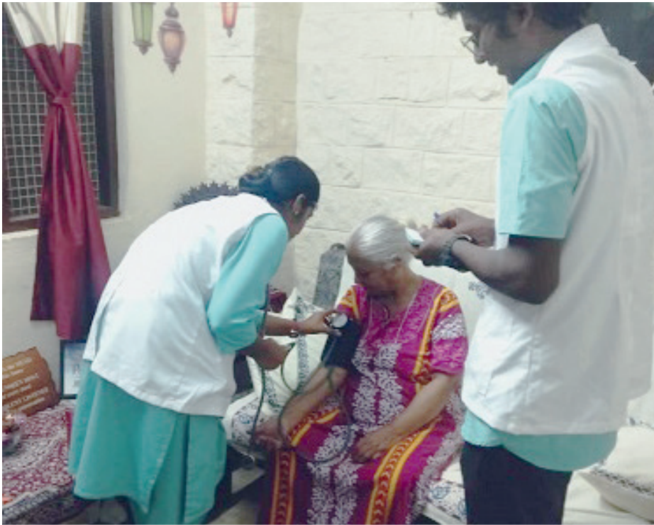
Один из христианских центров в Бангалоре предоставляет медицинскую помощь на дому тем, кто заболел ковидом и не может позволить себе лечение в больнице