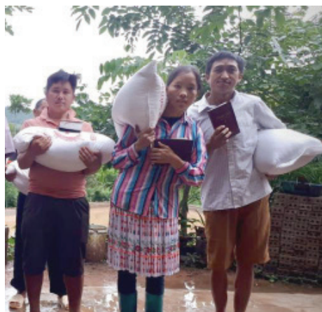
Христиане Юго-Восточной Азии получили Библии и рис от Фонда Варнава

следуют как этническое меньшинство и как христиан. Правительство считает христианство “западной” религией, поэтому ограничивает деятельность христиан, в том числе проповедь, образование и публикации. 100 семей христиан получили от Фонда Варнава рис, который поможет им выжить после недавнего неурожая. Также христиане получили Библии на местном языке — для многих это первая собственная Библия. Молитесь, чтобы Господь обильно благословил Свой народ пониманием Его драгоценного Слова. Просите Бога поддержать их во всех трудностях, с которыми они сталкиваются.