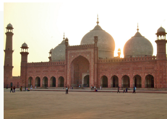
Мечеть Бадшахи, Лахор, Пакистан

З емля, где сейчас находятся Афганистан и Пакистан, имела огромное значение на протяжении большого периода истории. В этой точке сходятся Китай и Дальний Восток, Индийский субконтинент, Ближний Восток и Центральная Азия.