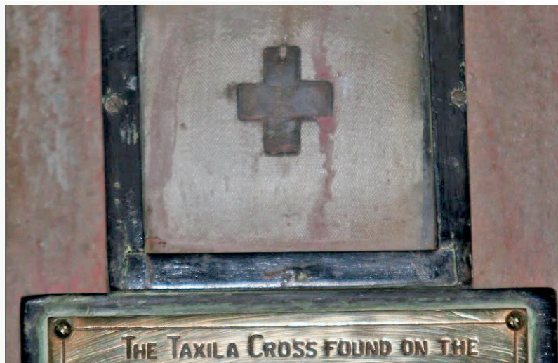
Таксильский крест обнаружен в 1935 году на месте древнего города Сиркап, недалеко от Таксилы, совр. Пакистан. Датируется II или III веком и свидетельствует о христианском наследии в этом регионе. В 1970 году этот крест стал символом пакистанской церкви

Поэтому афганские христиане не могут жить под властью талибов. Они оставили ислам, поэтому